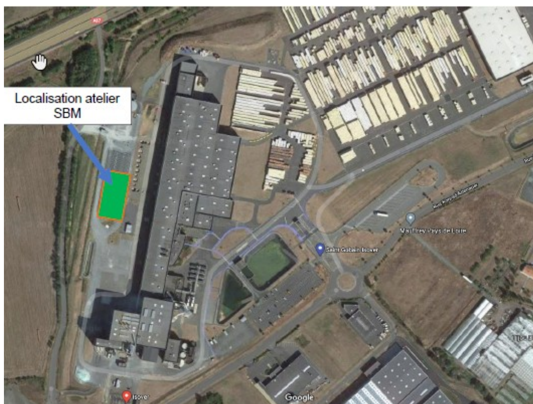
Figure 2: Localisation du futur atelier SBM

Le four sera implanté à l'intérieur d'un nouveau bâtiment d'environ 750 m 2 et de 14,40 m de hauteur.