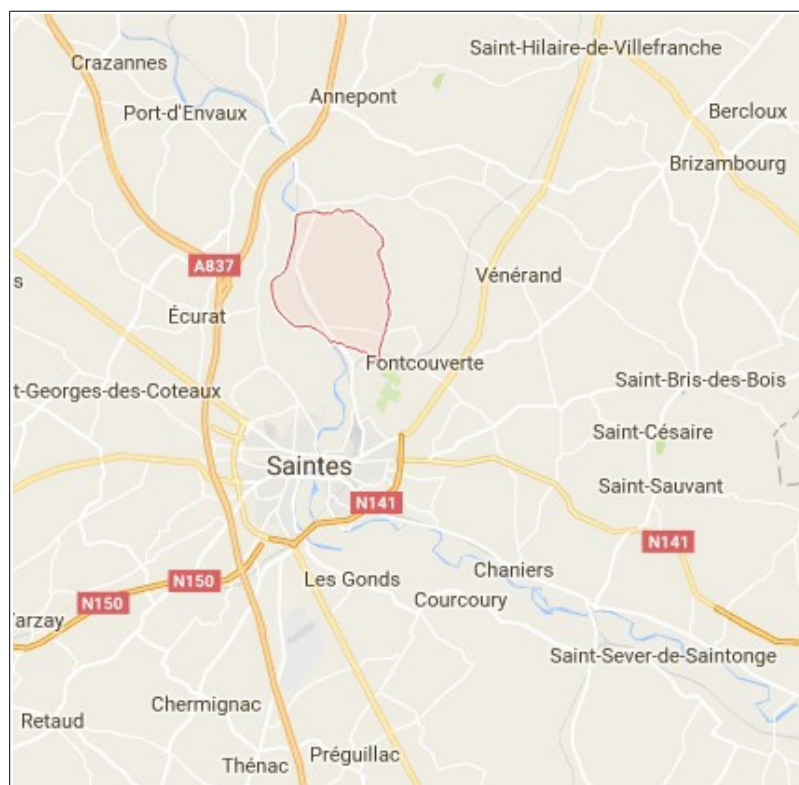
Localisation de la commune

La commune de Bussac-sur-Charente est située dans le département de la Charente-Maritime, à proximité immédiate de Saintes, dont elle est séparée par une partie du fleuve Charente. Elle couvre une superficie de 9,98 km 2 et comptait une population de 1 314 habitants en 2013.