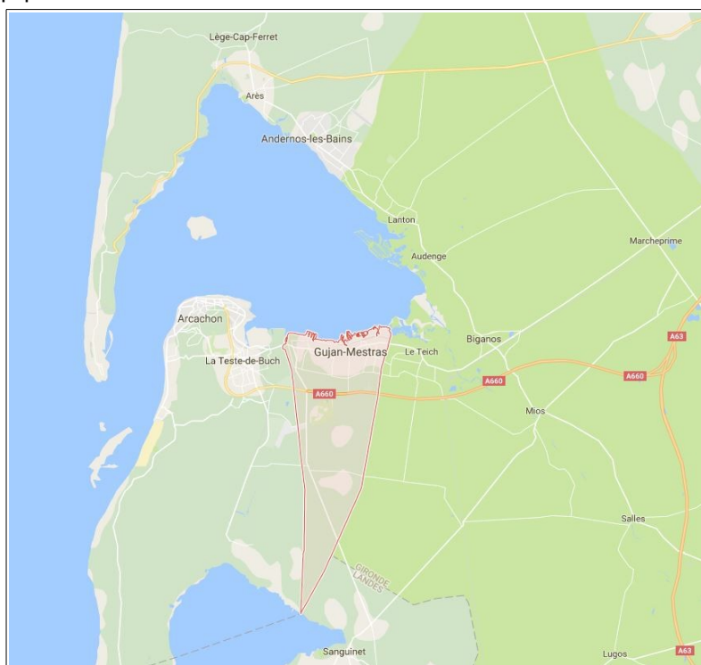
Localisation de la commune de Gujan-Mestras

Le projet communal envisage l'accueil d'environ 3 700 habitants d'ici 2029, soit une population totale de 27 000 habitants (par rapport à une estimation cohérente de la population atteinte en 2019, année probable d'entrée en vigueur du PLU). Pour cela, la commune mobilise 233 hectares. Parmi ces surfaces, 136 hectares (dont 49 hectares en densification) sont destinés à l'habitat pour la construction de 2 700 logements, 80 hectares aux activités économiques, de tourisme et de loisirs tandis que 17 hectares seront dédiés aux équipements.