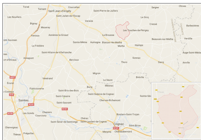
Localisation de la commune de Bagnizeau

Bagnizeau est une commune du département de la Charente-Maritime d'une superficie de 9,56 km 2 . Située à environ 35 km au Nord-Est de Saintes et à une vingtaine de kilomètres à l'Ouest de Saint-Jean-d'Angély, la commune compte 192 habitants en 2013 (INSEE). Le projet de révision du plan local d'urbanisme prévoit de porter la population à 220 habitants en 2030.