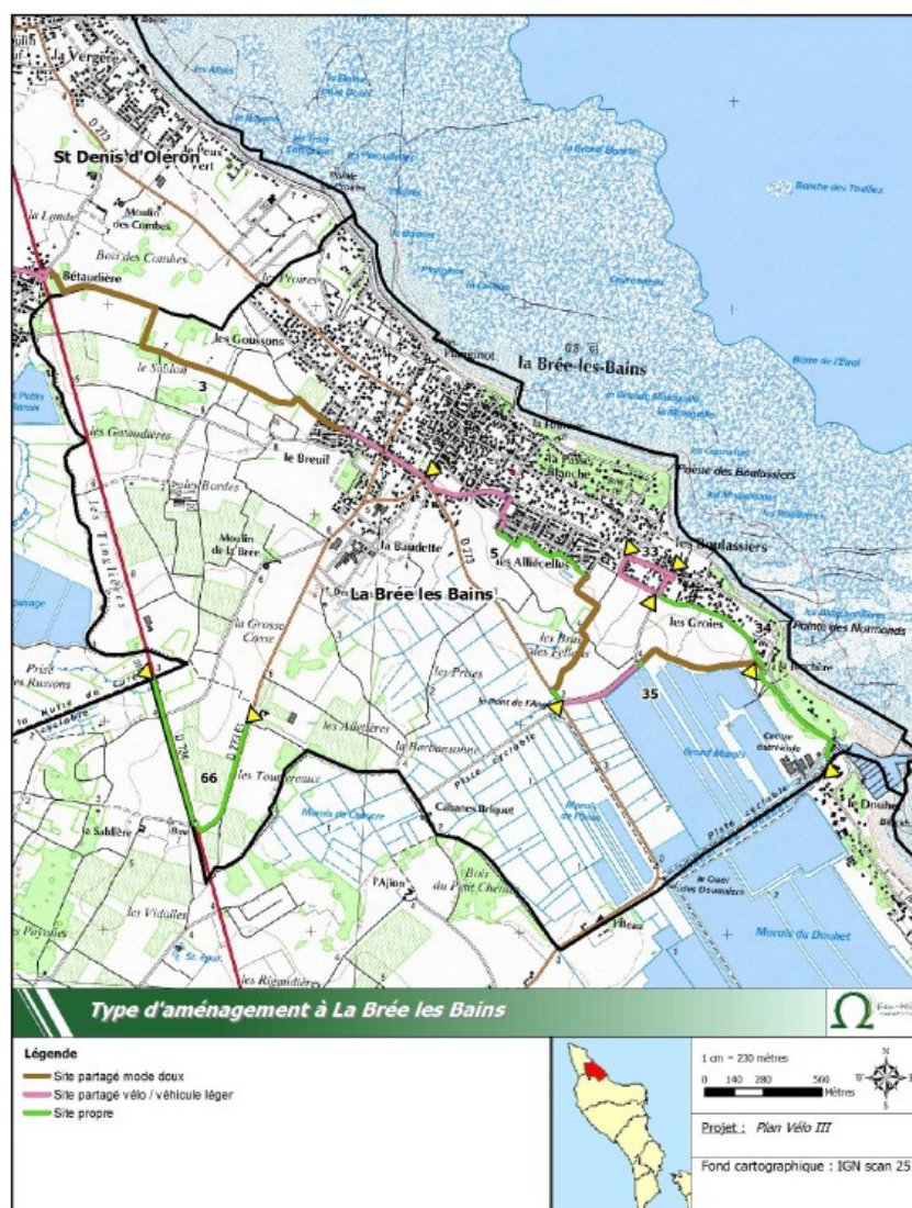
Carte 4 : Type d'aménagement à La Brée les Bains