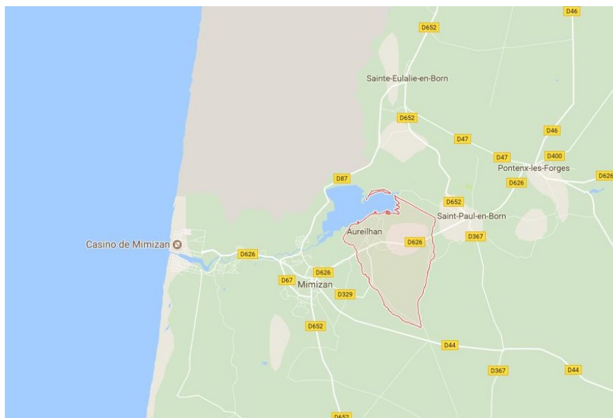
Localisation de la commune d'Aureilhan

Le projet communal envisage l'accueil d'environ 200 habitants dans les dix prochaines années. La commune souhaite mobiliser 15 hectares de potentiel foncier - dont neuf en extension et six en densification - avec la volonté de stopper la polarisation autour de l'axe de la route départementale n°626 et d'engager un repositionnement vers le lac.