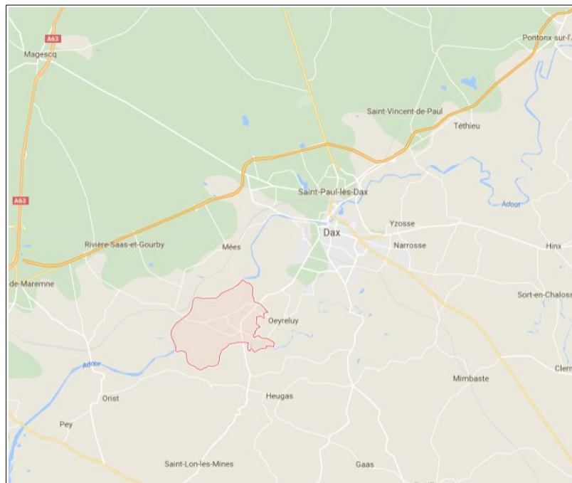
Localisation de la commune de Tercis-les-Bains

Lorsque l'action, l'opération d'aménagement ou le programme de construction est susceptible d'avoir des incidences notables sur l'environnement, les dispositions nécessaires pour mettre en compatibilité les documents d'urbanisme ou pour adapter les règlements et servitudes mentionnés au deuxième alinéa font l'objet d'une évaluation environnementale , au sens de la directive 2001/42/ CE du Parlement européen et du Conseil, du 27 juin 2001, relative à l'évaluation des incidences de certains plans et programmes sur l'environnement.