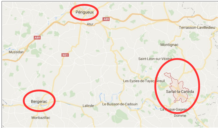
Localisation de la commune

La commune de Sarlat-la-Canéda est située dans l'est du département de la Dordogne, à proximité du département de la Corrèze. Elle présente une superficie de 47,13 km 2 et comptait, selon l'INSEE, 9 127 habitants en 2014. La commune appartient à la Communauté de communes de Sarlat-Périgord Noir qui a engagé l'élaboration d'un PLU intercommunal le 14 décembre 2015.