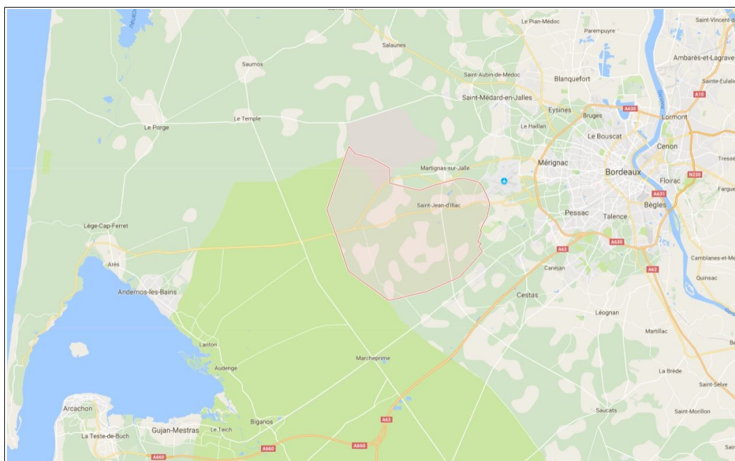
Localisation de la commune de Saint-Jean-d'Illac

Lorsque l'action, l'opération d'aménagement ou le programme de construction est susceptible d'avoir des incidences notables sur l'environnement, les dispositions nécessaires pour mettre en compatibilité les documents d'urbanisme ou pour adapter les règlements et servitudes mentionnés au deuxième alinéa font l'objet d'une évaluation environnementale, au sens de la directive 2001/42/ CE du Parlement européen et du Conseil, du 27 juin 2001, relative à l'évaluation des incidences de certains plans et programmes sur l'environnement.