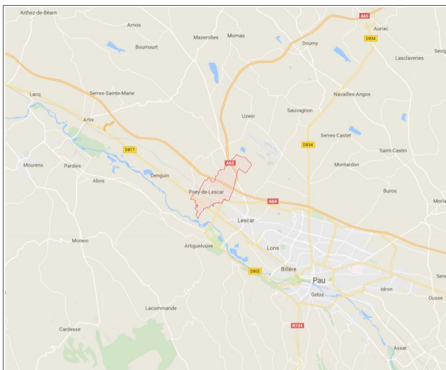
Localisation de la commune de Poey-de-Lescar

La mise en compatibilité du PLU fait donc l'objet d'une évaluation environnementale. Conformément aux dispositions de l'article L. 300-6 du Code de l'urbanisme, le présent avis de l'Autorité environnementale porte sur les dispositions de cette mise en compatibilité.