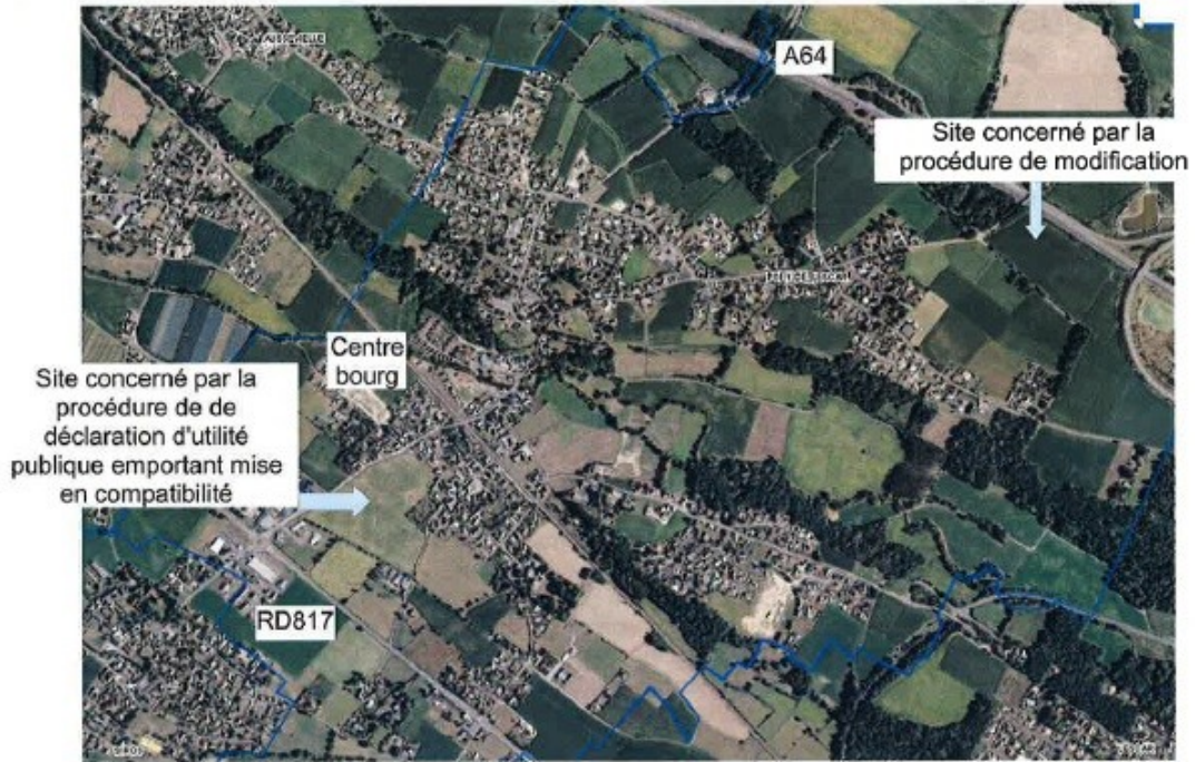
Plan de localisation des deux sites.