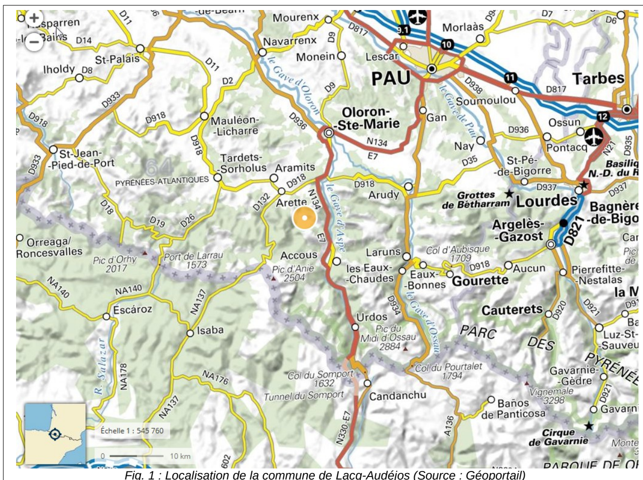
Fig. 1 : Localisation de la commune de Lacq-Audéjos

La commune est traversée par la RN 134 depuis la sortie de l'agglomération d'Oloron-Sainte-Marie nord jusqu'au tunnel du Somport et à l'Espagne au sud. Le territoire est accessible par la RD 241 qui traverse le territoire d'est en ouest, en fond de vallée de l'Arriçq.