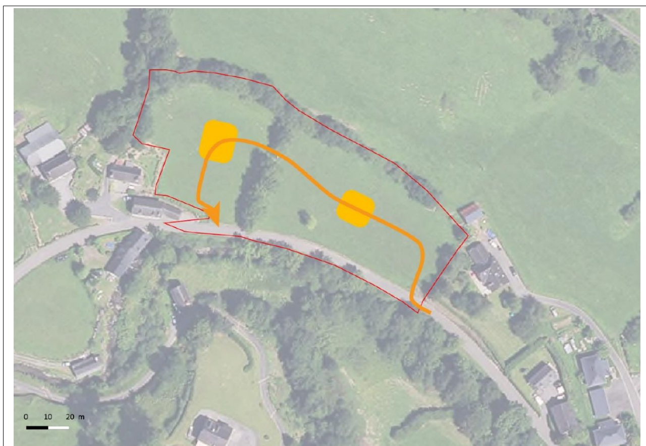
Fig. 3 : Schéma graphique de l'orientation d'aménagement et de programmation au lieu-dit Superbie

La commune, après un diagnostic du bâti mobilisable pour l'habitat, prévoit pour répondre au desserrement des ménages et à l'accueil de dix habitants supplémentaires à l'horizon 2027, la réalisation de quatre à six logements neufs au lieu dit Superbie. Le projet implique l'urbanisation de 0,8 ha, soit une diminution de 30 % de la consommation d'espace par rapport à la période 2007-2017. Le parti d'aménagement retenu est détaillé dans une orientation d'aménagement et de programmation (OAP) localisée en continuité de l'urbanisation existante (figure n°3).