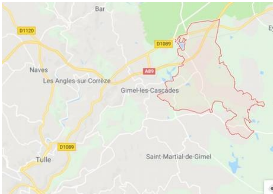
Localisation de la commune de Saint-Priest de Gimel

La commune de Saint-Priest-de-Gimel, dans le département de la Corrèze, est située à environ 13 km au nord-est de Tulle. Elle compte 501 habitants (insee 2015). Elle a décidé d'engager une procédure de modification simplifiée n°2 du PLU approuvé le 22 février 2007.