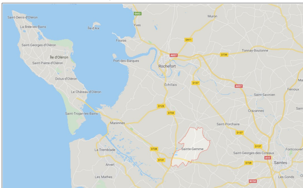
Localisation de la commune de Sainte-Gemme

Le projet d'aménagement et de développement durables (PADD) du PLU prévoit la production de 66 logements à l'horizon 2027. Pour ce faire, la collectivité souhaite mobiliser 1,5 hectares au sein des zones urbanisées et 1,3 ha en extension urbaine pour l'habitat.