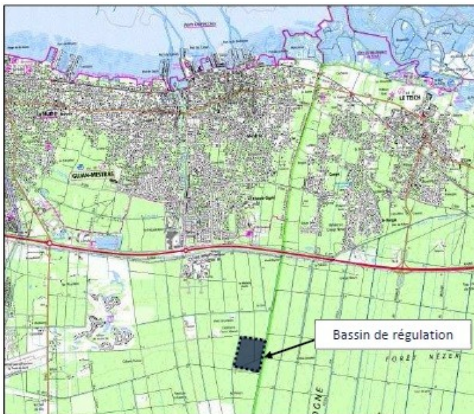
Localisation du site