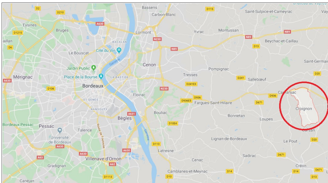
Localisation de la commune de Croignon

Le projet de modification simplifiée n°1 du PLU a deux objets. Il vise, d'une part, à améliorer les principes d'aménagement de la zone à urbaniser de Baquey et d'autre part, à permettre une activité agricole sur un secteur actuellement classé en zone naturelle N.