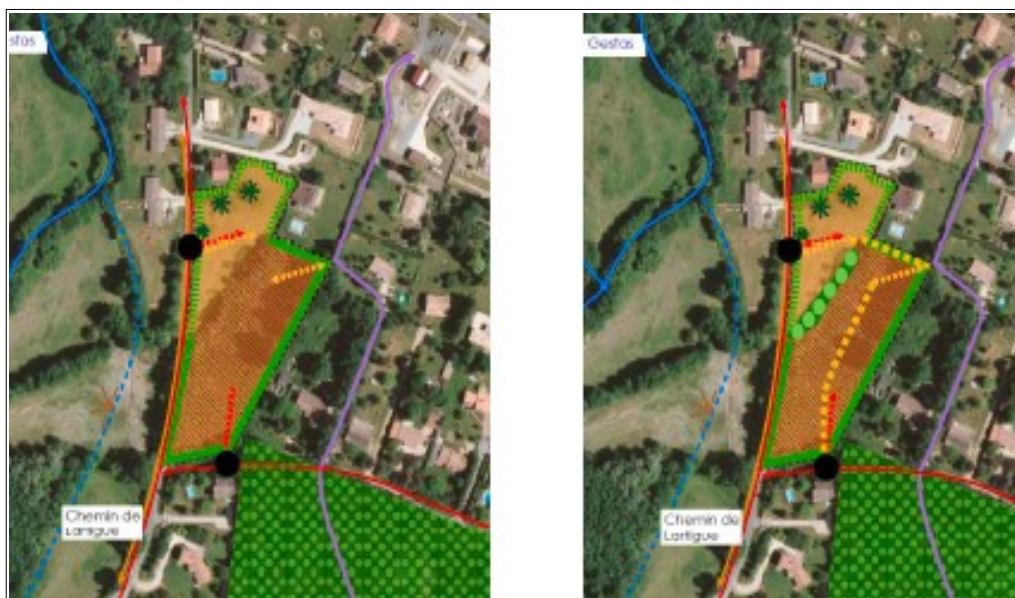
OAP en vigueur à gauche et OAP modifiée à droite

Les modifications proposées portent notamment sur des adaptations des principes d'accès et de circulation dans l'OAP ainsi que sur l'ajout d'une trame d'espaces boisés classés (EBC) sur le règlement graphique comme présenté ci-après :