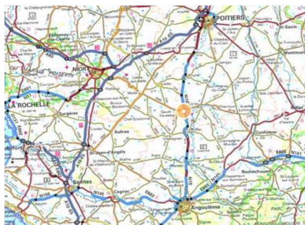
Secteur concerné par la révision allégée n°3 du PLU (Source : notice explicative page 4)

Le territoire de la commune n'est concerné par aucun site Natura 2000. La collectivité a saisi volontairement la Mission Régionale d'Autorité environnementale (MRAe) pour avis sur l'évaluation environnementale de la révision allégée n°3 du PLU de Limalonges.