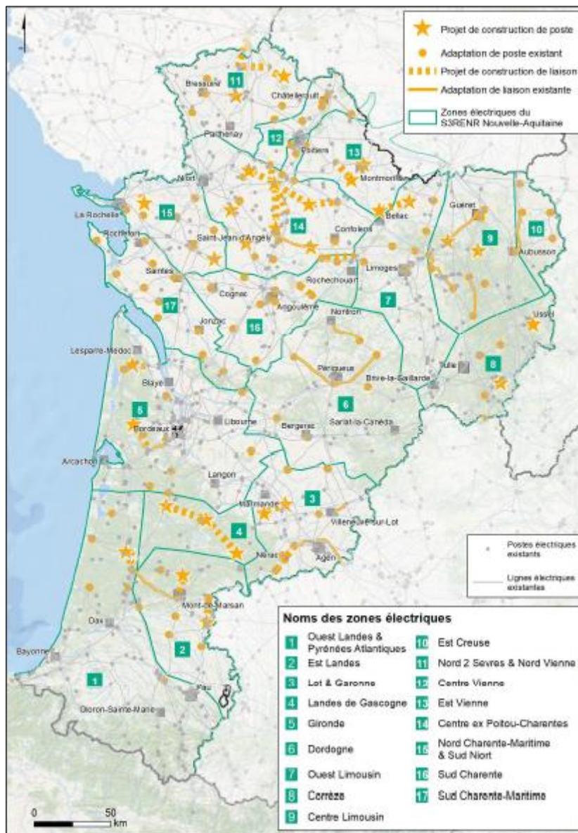
Aménagements envisagés sur le réseau électrique en Nouvelle-Aquitaine (source : page 13 du rapport de présentation du schéma S3REnR Nouvelle-Aquitaine)

Le S3REnR, qui planifie l'évolution du réseau électrique nécessaire à l'accueil des énergies renouvelables, comporte en particulier la prévision de travaux (créations d'ouvrages de raccordement et renforcement d'ouvrages existants), leur coût, ainsi que le financement à prendre en charge par chacune des parties (quote-part régionale à payer par les producteurs d'énergies renouvelables et financements assurés par les gestionnaires de réseaux).