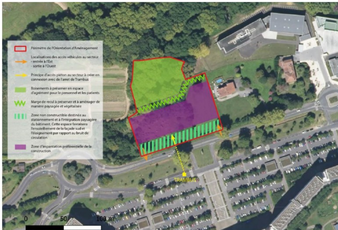
Orientation d'aménagement et de programmation du site après la mise en compatibilité

La MRAe recommande de compléter le dossier de mise en compatibilité du PLU de Bayonne afin de mieux justifier de la préservation des fonctionnalités hydrauliques de la zone humide, notamment au regard du règlement écrit de la zone N et au regard de l'usage qui sera fait de cet espace.