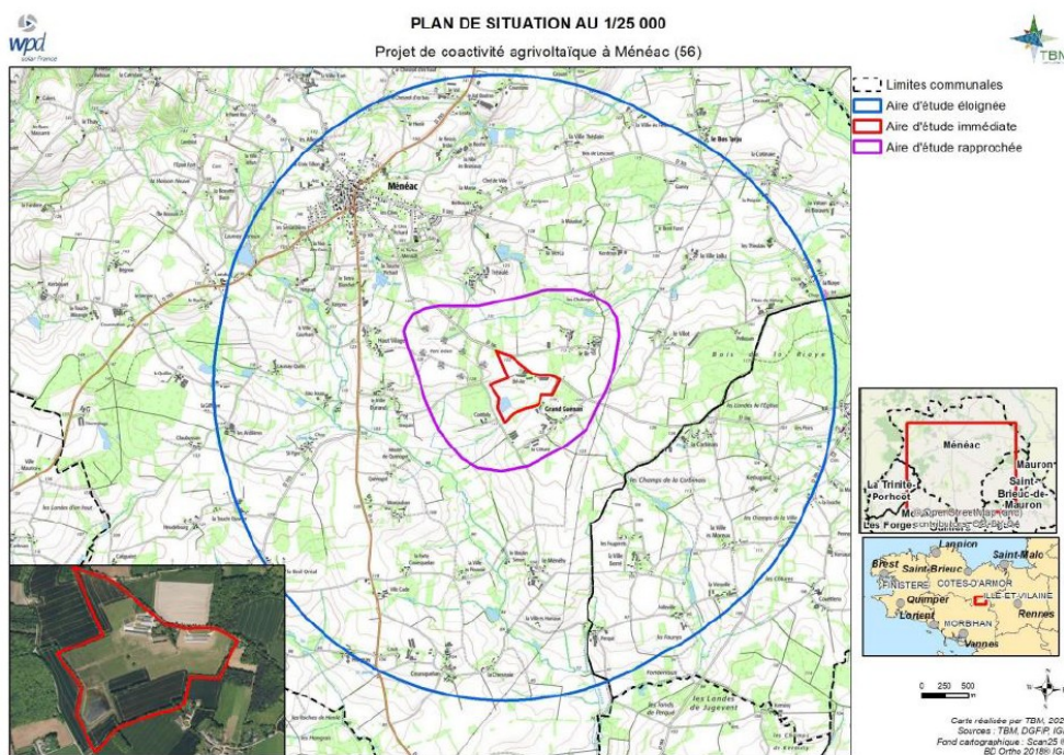
Localisation du projet

Il est localisé dans le département du Morbihan, sur la commune rurale de Ménéac, au lieu-dit Bel-Air à environ 2,5 km au sud-est du bourg. La zone d'implantation potentielle de la centrale photovoltaïque se situe sur les terres agricoles 3 d'un élevage de 30 000 à 40 000 poules pondeuses en plein air, à proximité de la route départementale (RD) 106 (au nord).