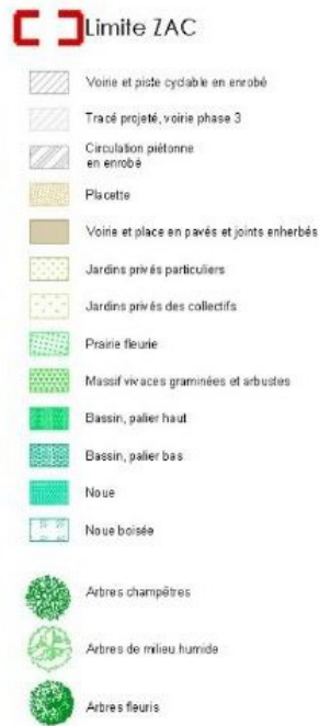
Illustration 2: Plan de composition du projet