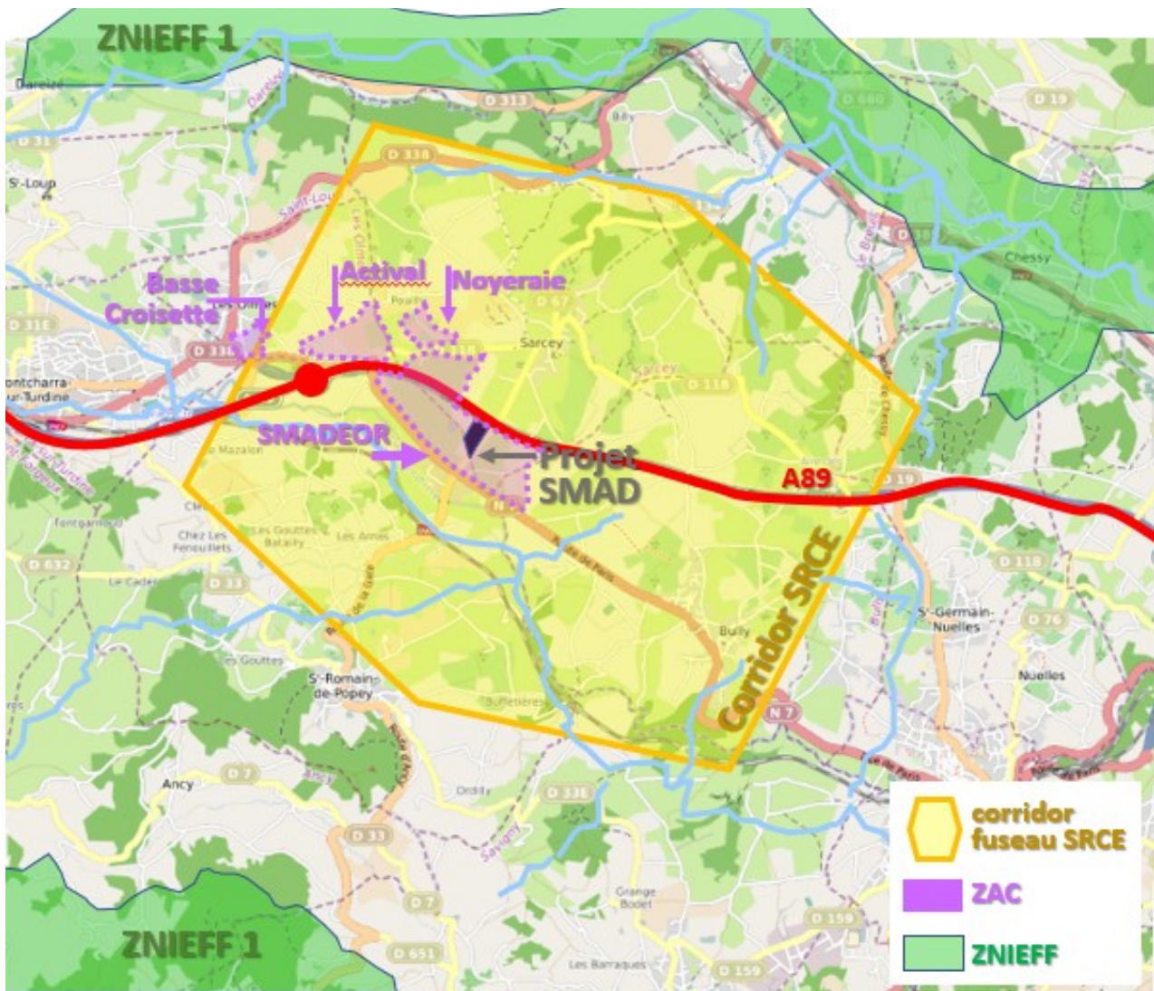
Illustration 1 – situation du projet

La zone du projet, située sur la commune de Sarcey, est délimitée au sud par la limite communale avec Saint-Romain-de-Popey, au nord par l'autoroute A89 et à l'est par la route départementale RD67. Celle-ci relie par ailleurs les centres-bourgs de Saint-Romain-de-Popey et de Sarcey et servira de voie d'accès au site.