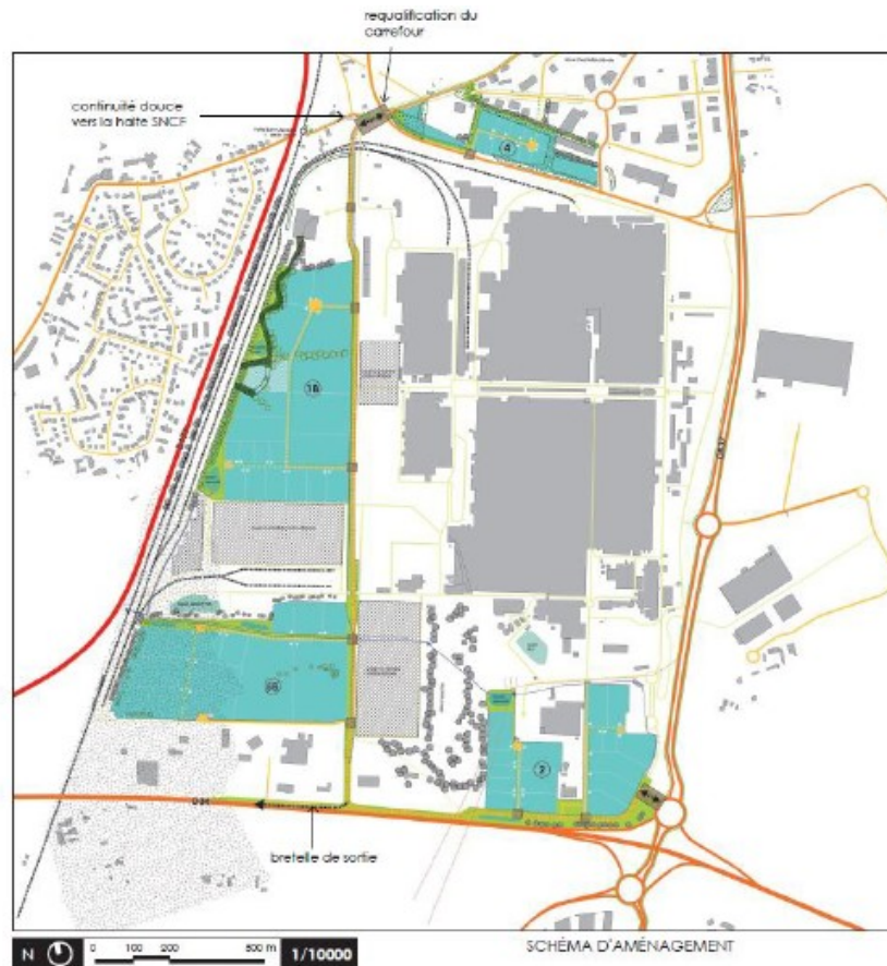
Illustration 2 : Schéma d'aménagement

La présentation d'une analyse des déplacements des poids lourds en phase travaux avec les mesures permettant de limiter les nuisances liées aux transports de matériaux mérite d'être menée dans cette situation.