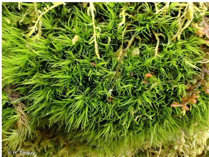
(Dicrane vert)

Le projet du PLU a pour objectifs d'attirer de nouveaux habitants en maintenant et en développant les activités économiques locales et celui du tourisme, tout en contenant l'urbanisation au sein de la zone urbaine actuelle. Une dizaine d'hectares est mobilisée dans le projet de PLU à cet effet. Pour autant, le PLU ne prévoit aucune zone d'extension de l'urbanisation. La densification du tissu urbain s'effectuera surtout dans le centre-bourg de Wangenbourg, à Obersteigen et à Engenthal-le-Bas sur des secteurs U déjà existant et majoritairement en dents creuses.