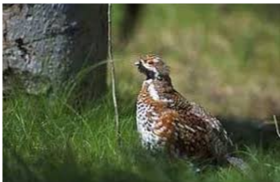
(Gelinotte des bois)

Ces sites abritent des habitats principalement forestiers, mais aussi en moindre proportion, des milieux aquatiques et humides (tourbières, forêts alluviales et cours d'eau), des pelouses et des prairies maigres de fauche. Certains habitats sont de niveau communautaire et 4 sont considérés comme prioritaires : les tourbières hautes actives, les tourbières boisées, les aulnaies-frênaies alluviales et les forêts de pente. Le site abrite 6 espèces inscrites à l'annexe 2 de la directive Habitat, dont 2 chauves-souris (le Petit rhinolophe et le Grand murin) et le Lynx boréal. Le Dicrane vert, espèce végétale communautaire, est également recensée.