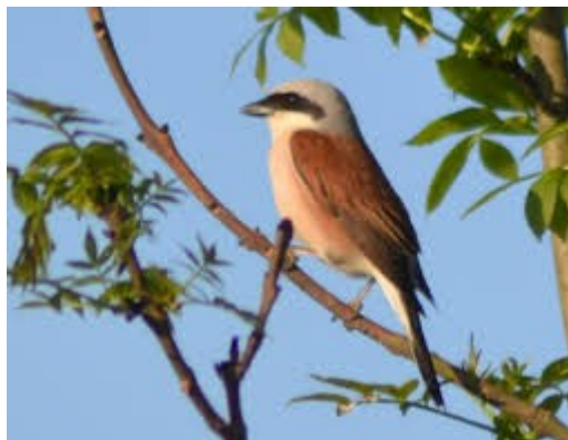
(Pie-grièche écorcheur)

Elle recommande en particulier d'analyser les possibilités de reclassement en N des secteurs U inclus dans la zone Natura 2000 et d'évaluer les conséquences de l'évolution du PLU sur la fréquentation des zones Natura 2000.