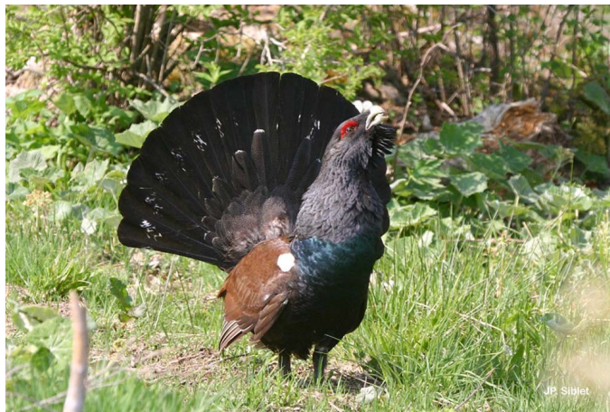
(Grand tétras)

85 % du territoire communal, soit près de 2700 ha, est constitué de forêt. Les densités varient de 4 à 6 logements à l'hectare, Wangenbourg étant le secteur ayant historiquement connu la densité la plus forte.