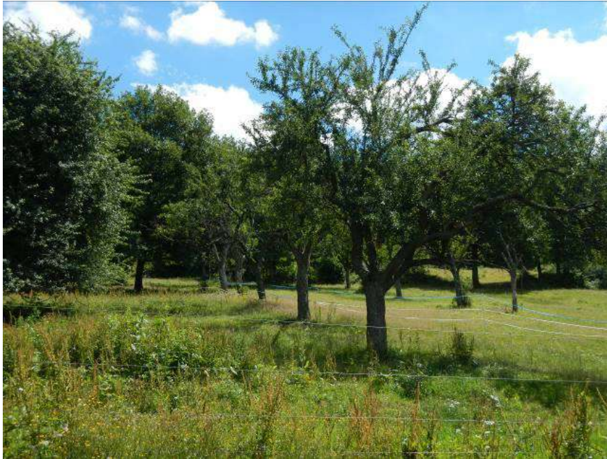
Des vergers « pleins vent à hautes tiges », un des habitats caractéristiques de la vallée de la Bruche.

Les secteurs des Bruyères en projet d'extension 1AU et 1AUx sont également concernés par des zones humides. Une procédure d'évitement est bien proposée mais ne concerne pas toute la zone humide référencée et aucune mesure de compensation n'est proposée.