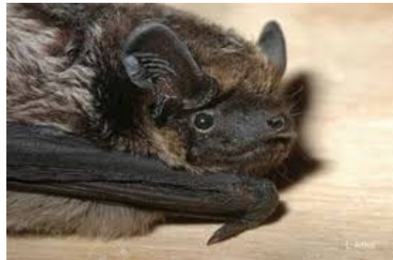
Barbastelle d'Europe

Le dossier conclut que le projet de PLUi-H aura des incidences faibles, voire négligeables sur les habitats et les espèces des sites Natura 2000. En l'absence d'étude d'incidences exhaustive, l'Ae émet des réserves sur ces conclusions.