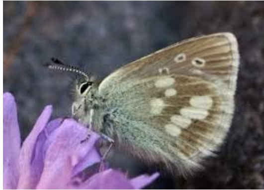
Azuré des paluds

L'évaluation environnementale conclut à des incidences faibles, voire nulles sur cette ZSC. L'Ae attire l'attention de l'intercommunalité sur la présence dans cette ZSC, et surtout dans la zone UD à Flin, de l'Azuré des paluds, papillon menacé au niveau européen, de 9 espèces de chiroptères dont 3 d'intérêt communautaire (Petit rhinolophe, Vespertilion à oreilles échancrées et Grand murin) ayant mené à la désignation de la ZSC et qui risquent d'être impactés par l'urbanisation.