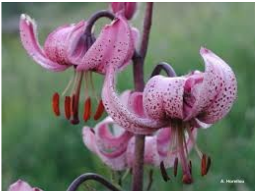
Lys martagon – Source : inpn.mnhn.fr

L'évaluation environnementale conclut à des incidences faibles, voire nulles sur cette ZSC. L'Ae attire l'attention de l'intercommunalité sur la présence dans cette ZSC de plantes rares telles que le Lys martagon et la Langue de serpent ainsi que de chiroptères dont 2 d'intérêt communautaire (Vespertilion de Bechstein et Barbastelle d'Europe) qui risquent d'être impactés par l'urbanisation.