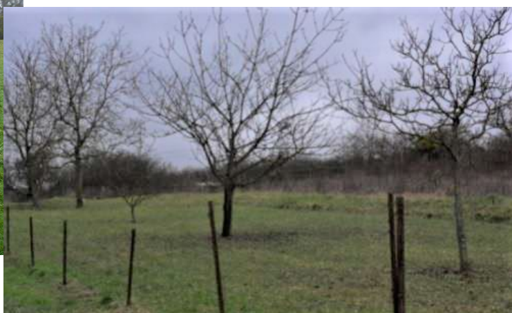
Illustration 4 : Vergers