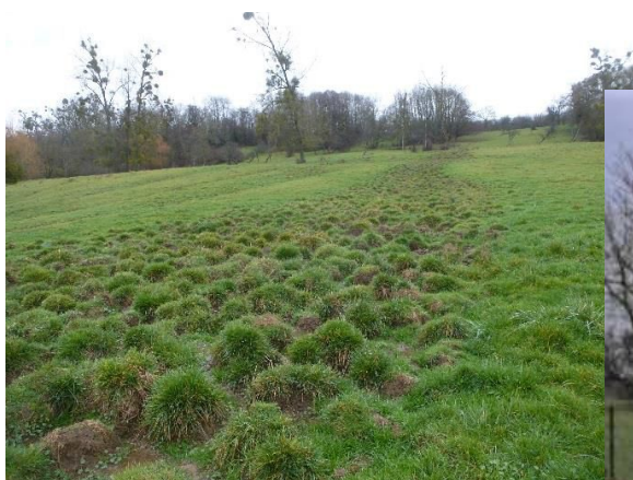
Illustration 3 : Zone humide du coteau de la Vache

La commune a également veillé à préserver ses boisements avec un classement en espaces boisés classés des principales haies et ripisylves 20 et un classement en zone Nf des bois de Remezaine et de Jacob. Les zones de coteaux, qui constituent un corridor d'intérêt local, sont classées en zone Nc. L'Ae partage ces conclusions mais aurait souhaité qu'un zonage spécifique soit dédié aux zones humides qui ont pourtant bien été inventoriées sur le terrain. Un sous zonage permettrait de protéger ces zones particulières et d'adapter le règlement aux mieux de l'intérêt de ces zones.