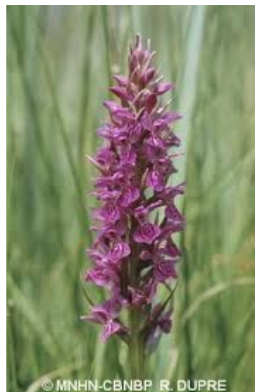
Orchis négligé

Pour l'Ae, les principaux enjeux environnementaux de ce dossier sont :