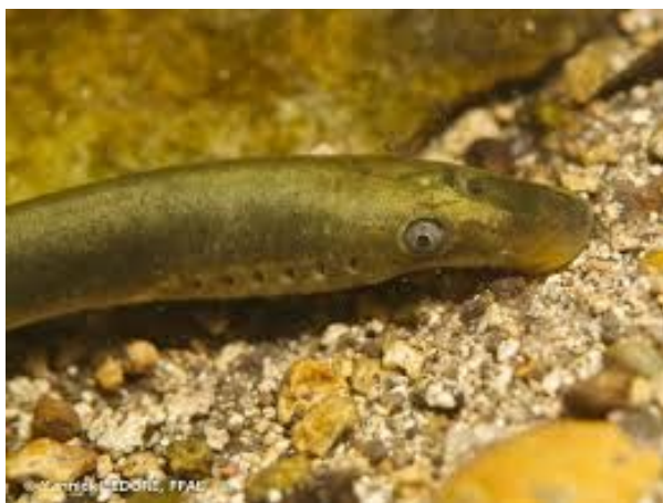
Lamproie de Planer

Le projet est soumis à évaluation environnementale en raison de la présence d'un site Natura 2000 3 sur son territoire. Il s'agit de la Zone spéciale de conservation (ZSC) « Marais de la Vesle en amont de Reims ». Les marais de la Vesle sont constitués de tourbières, de formations boisées et de terres agricoles. Parmi les espèces inscrites à l'annexe II de la directive européenne qui ont permis la détermination du site, on peut citer la Lamproie de Planer, le Triton crêté et l'Orchis négligé. Par ailleurs, le document recense également une Zone naturelle d'intérêt écologique faunistique et floristique (ZNIEFF) 4 de type 1, une ZNIEFF de type 2, des zones humides et à dominante humide et des corridors écologiques.