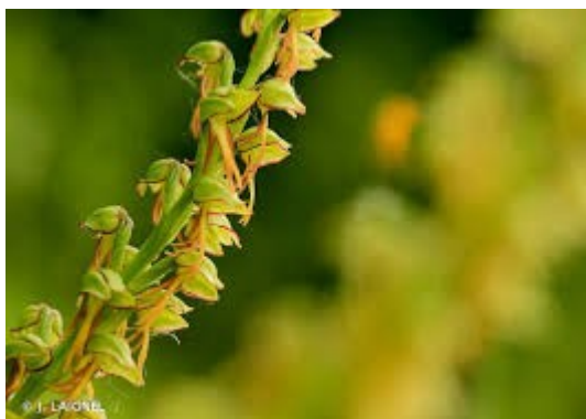
Orchis homme-pendu