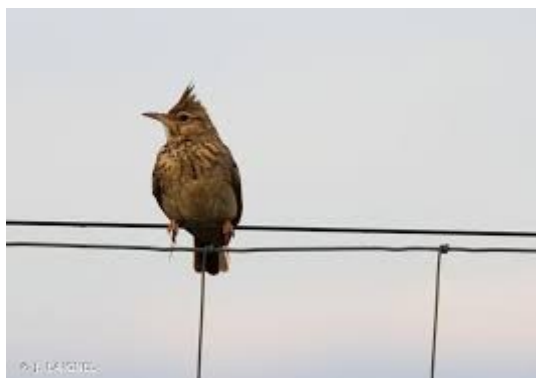
Cochevis huppé

L'Ae observe la proximité de la ZNIEFF « Colline calcaire du Grasberg à Bergheim et Rorschwihr » avec la zone urbanisée. Cette ZNIEFF s'étend sur des zones A, N et NM (secteur recouvrant le cimetière militaire) où les possibilités d'urbanisation sont contraintes par le règlement. L'Ae relève la présence dans cette ZNIEFF de pelouses sèches sur calcaires qui accueillent des espèces exceptionnelles, dont beaucoup sont menacées comme l'Orchis militaire et l'Orchis homme-pendu, qu'il convient de préserver et qui risquent d'être impactées par la proximité des zones urbaines.