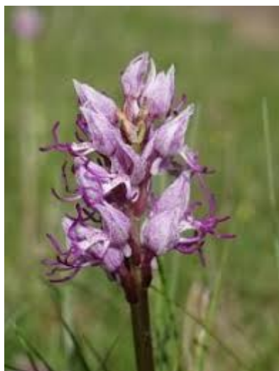
Orchis militaire

L'Ae recommande de réaliser des études complémentaires quant à d'éventuelles incidences sur les milieux naturels inventoriés dans la ZNIEFF « Colline calcaire du Grasberg à Bergheim et Rorschwihr ».