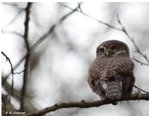
Chouette chevêche

L'Ae recommande d'approfondir son étude des incidences sur le site Natura 2000 « Ried de Colmar à Sélestat, Haut-Rhin » et de proposer des mesures de protection si besoin.