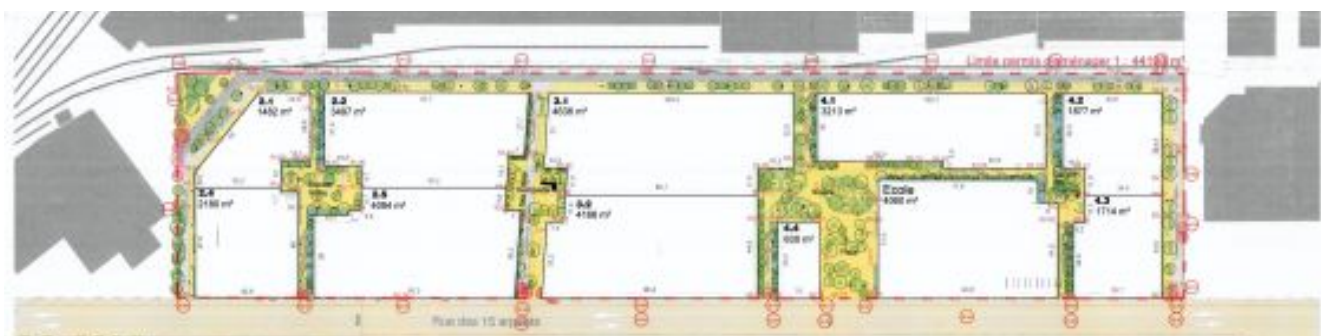
Illustration 3 : Plan de composition (pièce 4 de la demande de permis d'aménager)

L'opération sera réalisée en plusieurs phases de juillet 2024 à décembre 2029. Le présent permis d'aménager porte sur sa première phase (4 ,4 ha, partie du secteur situé au sud du RER C)