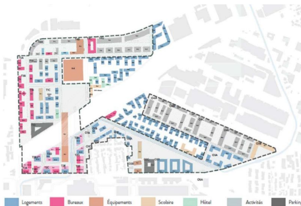
Illustration 5 : Plan de programmation (ZAC à l'intérieur du tireté noir, « Parcs en scène » à l'extérieur)

Selon les informations mises à la disposition du public lors de la concertation relative à la ZAC 6 , « sur un périmètre de plus de quarante hectares, l'aménagement du Sénia a pour principale ambition de répondre aux besoins d'un territoire abîmé et fragmenté. Le Sénia va devenir un quartier mixte qui regroupera une programmation très diverse, allant du logement aux commerces de proximité, en passant par des bureaux et des locaux d'activités, accompagnés par la réalisation d'équipements publics et sportifs (groupes scolaires, gymnase, équipement culturel). La volonté de créer un nouveau réseau de rues et voies de circulation sur le quartier avec la mise en place de nouvelles continuités piétonnes, d'itinéraires cyclables, d'espaces verts est une priorité du projet. Le pôle de transports autour de la gare de RER favorisera l'interconnexion vers Paris et les communes d'Île-de-France ».