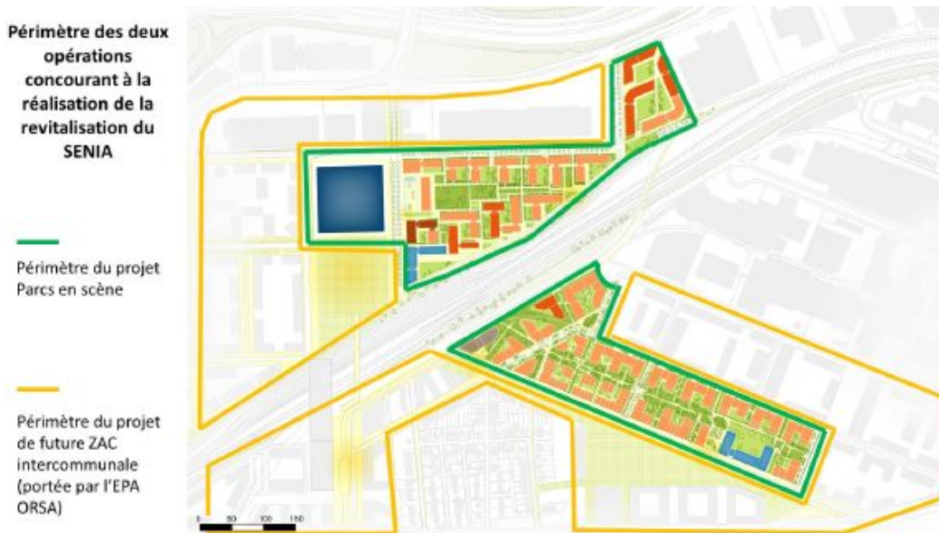
Illustration 2 : Périmètre des deux opérations concourant à la réalisation de la revitalisation de la zone du Sénia Y figure la programmation prévue sur les deux lots de l'opération « Parcs en scène »

L'opération sera réalisée en plusieurs phases de juillet 2024 à décembre 2029. Le présent permis d'aménager porte sur sa première phase (4 ,4 ha, partie du secteur situé au sud du RER C)