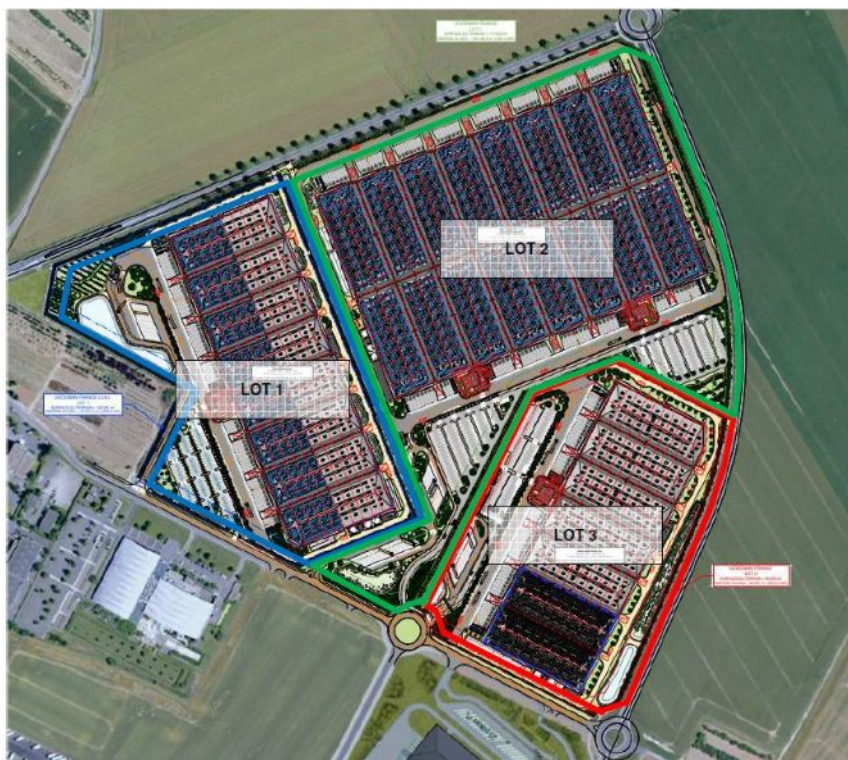
Figure 3 : plan masse des trois lots sur lesquels s'implantent les trois bâtiments projetés

L'étude d'impact précise que les bâtiments 1 et 2 sont équipés de panneaux photovoltaïques au niveau des toitures. Cette information n'est mentionnée qu'à la page 295 de l'étude d'impact, sans plus de détails (notamment la surface représentée par les panneaux).