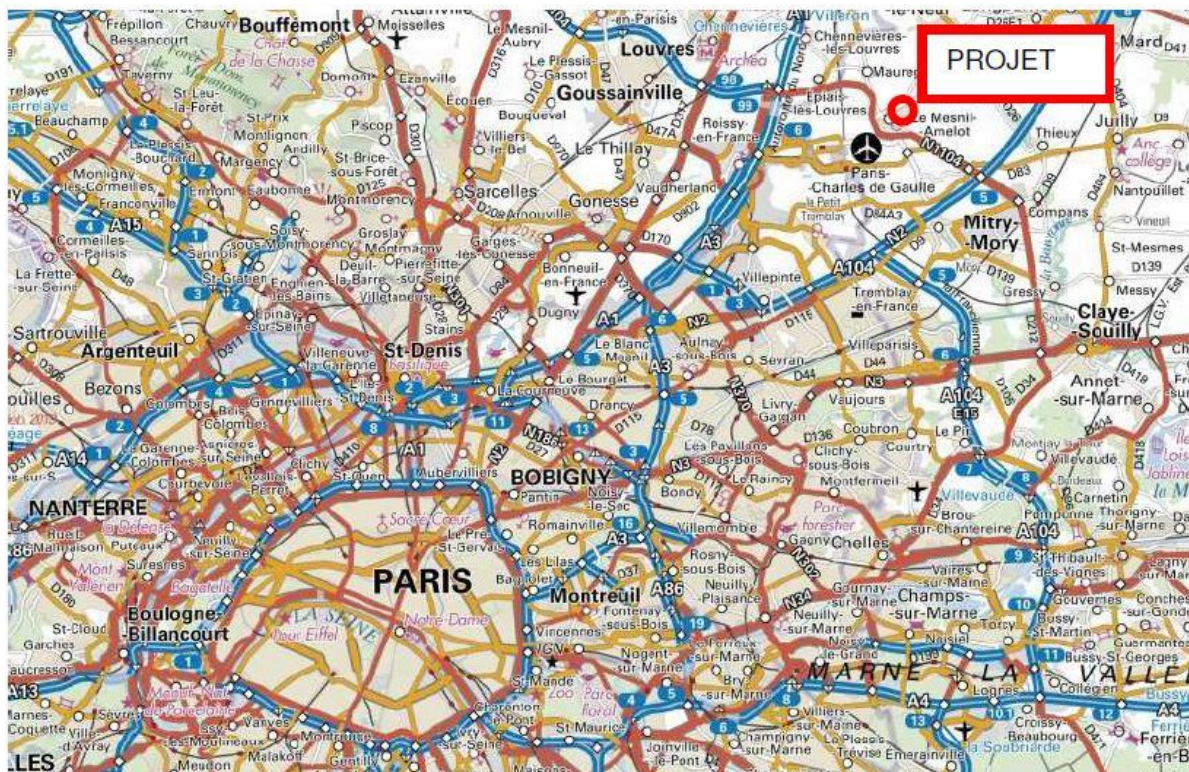
Figure 1 : localisation géographique de la ZAC « La Chapelle de Guivry » où se situe le projet de la société Goodman France