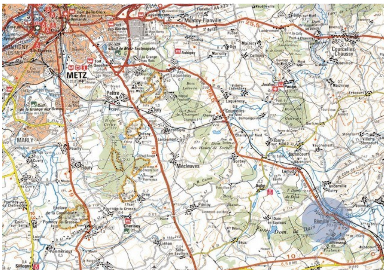
Localisation géographique de la commune de Rémilly

La procédure de mise en compatibilité du Plan local d'urbanisme (MEC-PLU) de Rémilly est portée par la communauté de communes. Ce PLU, approuvé le 28 août 2006, a connu plusieurs évolutions, dont une modification simple approuvée le 16 décembre 2013 et une modification approuvée le 3 mars 2016.