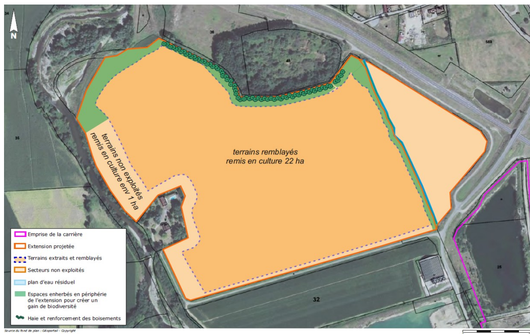
Carte qui présente la fin de l'exploitation et du remblaiement (état final de la zone d'extension) – 58 ans après l'autorisation- extrait de l'étude d'impact page 615 – réalisation SOE

Après 25 ans et l'arrêt complet de l'extraction, le remblaiement se poursuivra sur la zone d'extension par une nouvelle phase qui devrait se dérouler sur 33 années et conduire au comblement complet des 10 hectares restant de la zone d'extension.