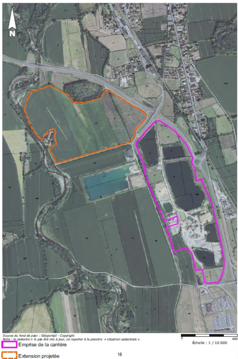
Localisation du projet extrait de l'étude d'impact

La Société des carrières Lourdaises (SOCARL) souhaite poursuivre et pérenniser ses activités sur une parcelle limitrophe de la carrière de sables et graviers qu'elle exploite sur les communes de Larreule et de Maubourguet (65), dans le département des Hautes-Pyrénées, en rive droite de l'Echez. Les réserves de gisement sur la carrière actuelle représentent moins de deux années d'exploitation. Une extension de cette carrière est donc souhaitée.