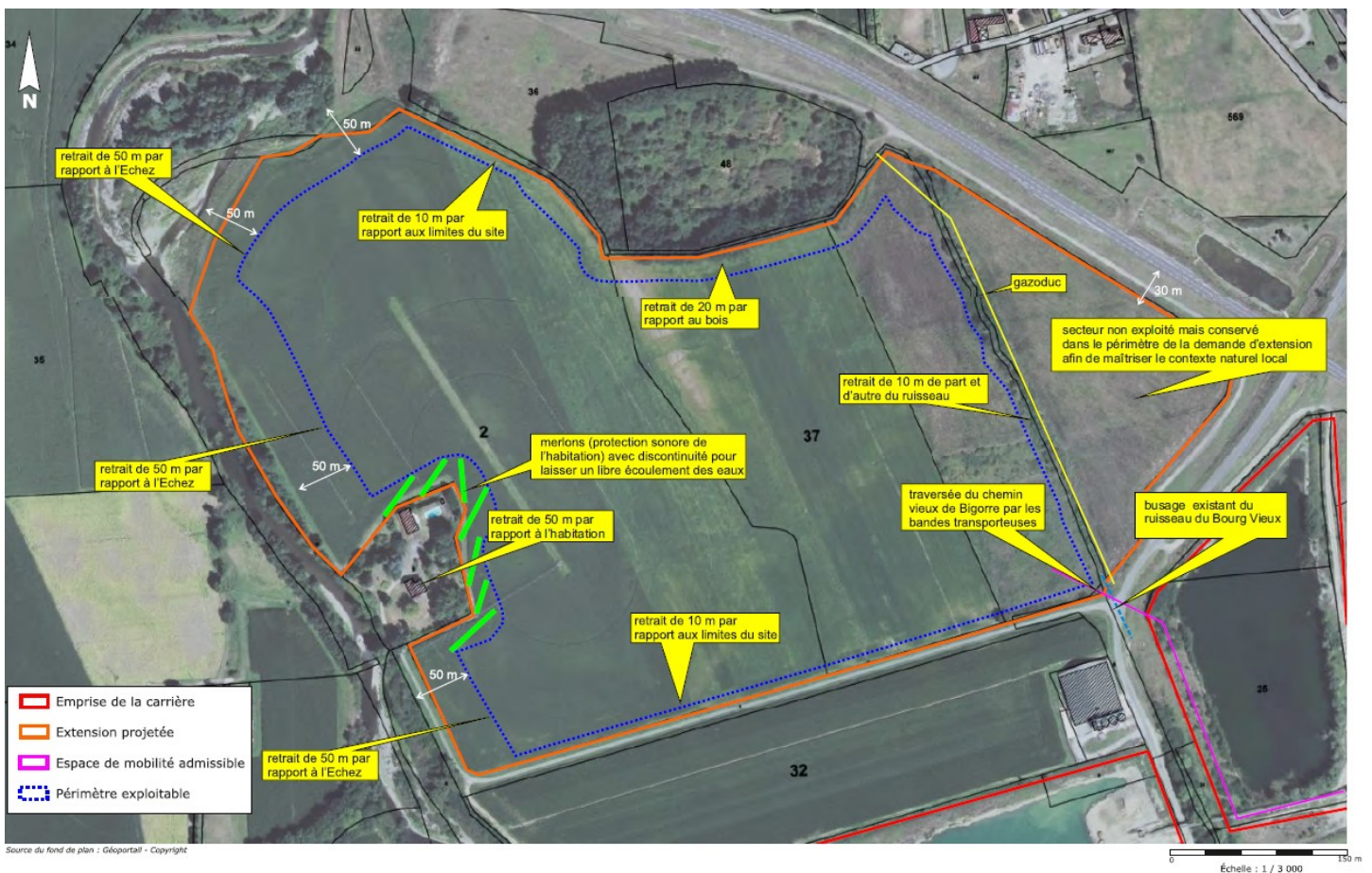
Définition du projet de la carrière- extrait de l'EI p 22 – source orthophoto IGN- réalisation SOE