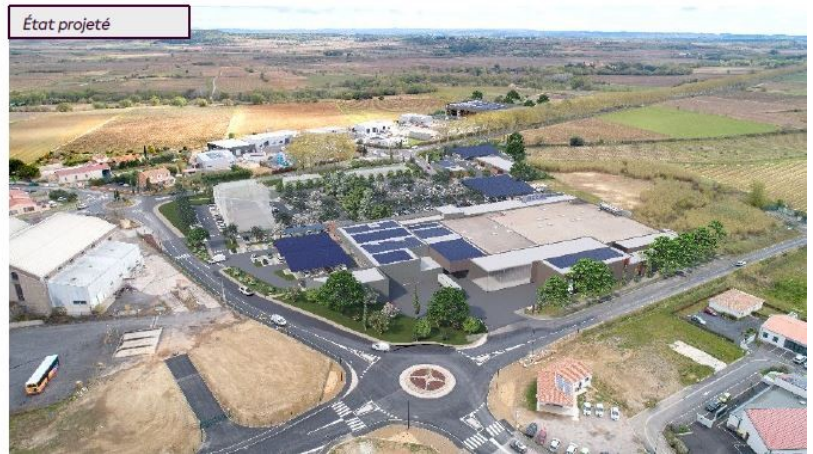
Insertion du projet dans son environnement