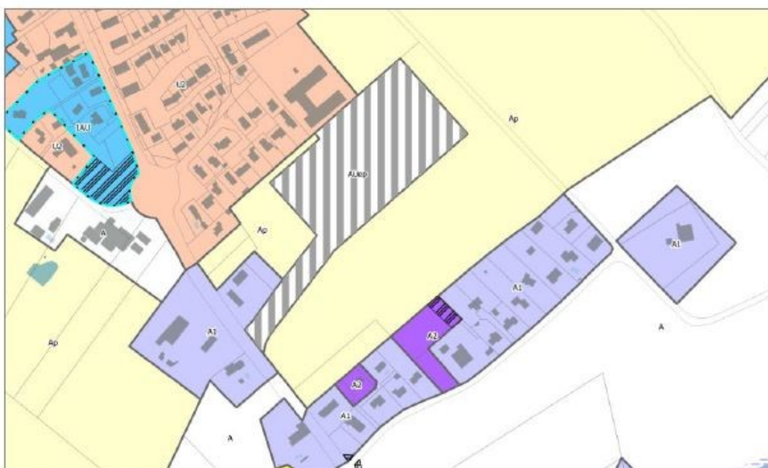
Figure 6 : extrait du document graphique du PLU après mise en compatibilité

Evolution du règlement graphique ( p.8 de la notice)