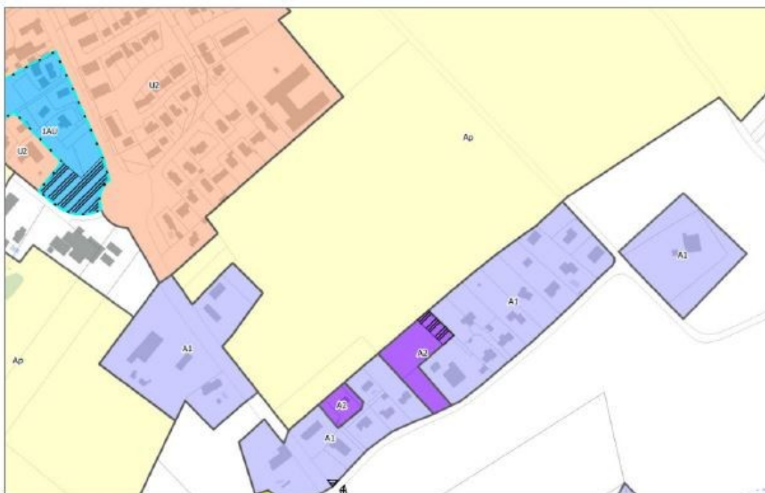
Figure 6 : extrait du document graphique du PLU en vigueur