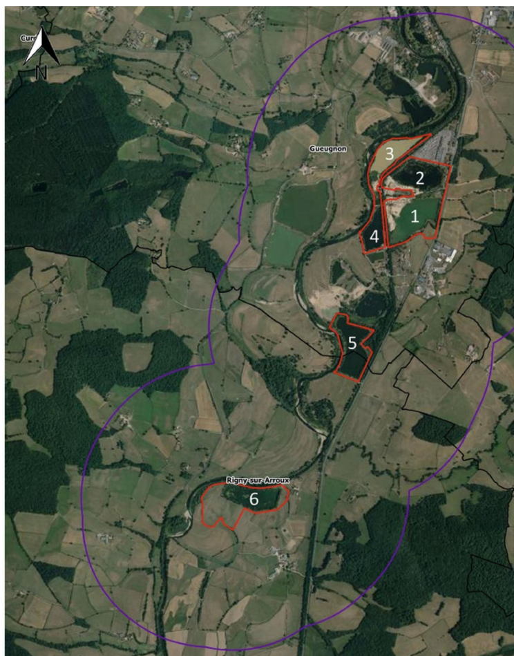
Carte des zones d'étude

Le site d'étude est entièrement intégré dans une ZNIEFF 6 de type 1 « Basse vallée de l'Arroux » et une ZNIEFF de type 2 « L'Arroux d'Autun à Digoïn » et est situé en zone inondable de l'AZI 7 .