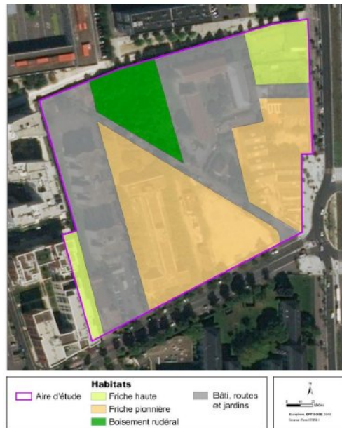
Fig 4 Localisation des habitats présents

Concernant les milieux naturels en présence, l'étude d'impact, dans l'état initial, indique, que le site se situe à 1,4 km au sud-est du Parc départemental des Hautes-Bruyères, espace naturel sensible (ENS) auquel il est relié par un corridor écologique (la coulée verte).