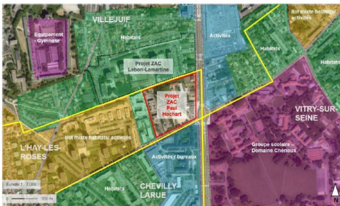
Fig 1. Localisation et environnement du site du projet.

Dans la présente version le projet prévoit désormais la réalisation de deux tours de 14 et 15 étages en entrée de ville dans le secteur sud-est du site de la ZAC, ainsi que celle d'une résidence senior située dans le secteur sud-ouest. L'étude d'impact actualisée indique l'accroissement des hauteurs de ces deux tours a permis de dé-densifier les autres bâtiments en y introduisant l'épannelage et des ouvertures (page 245).