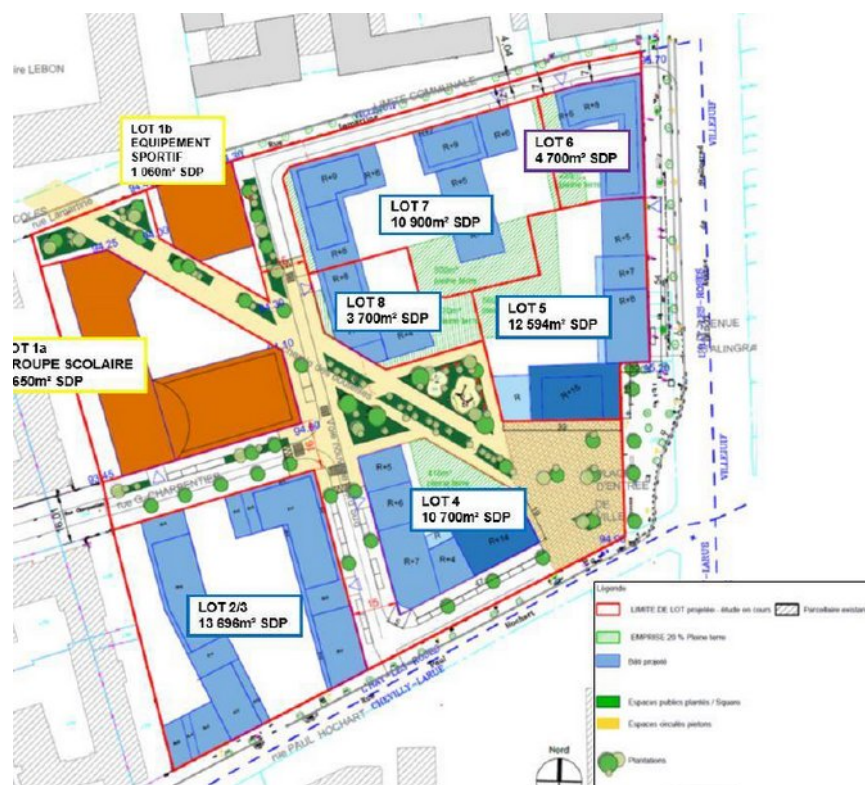
Fig 2. Plan masse du projet

La MRAe note la qualité des descriptions fournies, excepté le plan masse qui gagnerait à comporter des justifications sur l'agencement du bâti et ses usages.