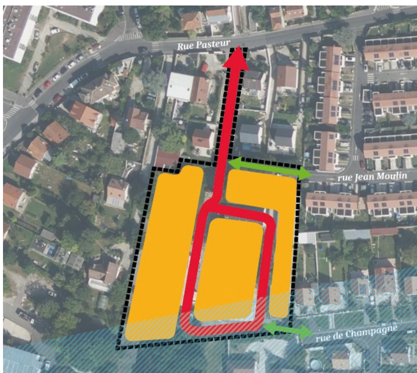
Figure 1: Schéma de l'OAP

Considérant que le secteur de l'OAP projetée au 26 rue Pasteur est particulièrement affecté par une pollution sonore qui, selon la carte de BruitParif (ci-dessous reproduite) est évaluée dans la journée à 60-65 dB(A); que ce niveau sonore est bien supérieur aux valeurs-guides au-delà desquelles l'Organisation mondiale de la santé considère que cette pollution porte atteinte à la santé des populations (53 dB pour les routes, 45 dB pour les avions) ; que si le dossier précise qu'aucune habitation ne sera implantée dans le périmètre de la zone C du plan d'exposition au bruit aéroportuaire, cette restriction conduit seulement à permettre de nouvelles habitations au nord du secteur de l'OAP, alors qu'elles seront exposées au même niveau sonore selon la carte de Bruitparif ;