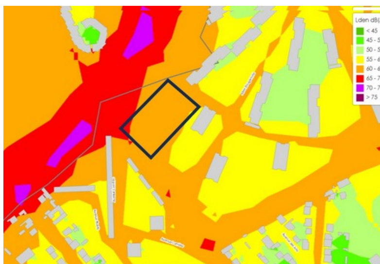
Figure 2: carte de l'intensité sonore et repérage du secteur appelé à évoluer