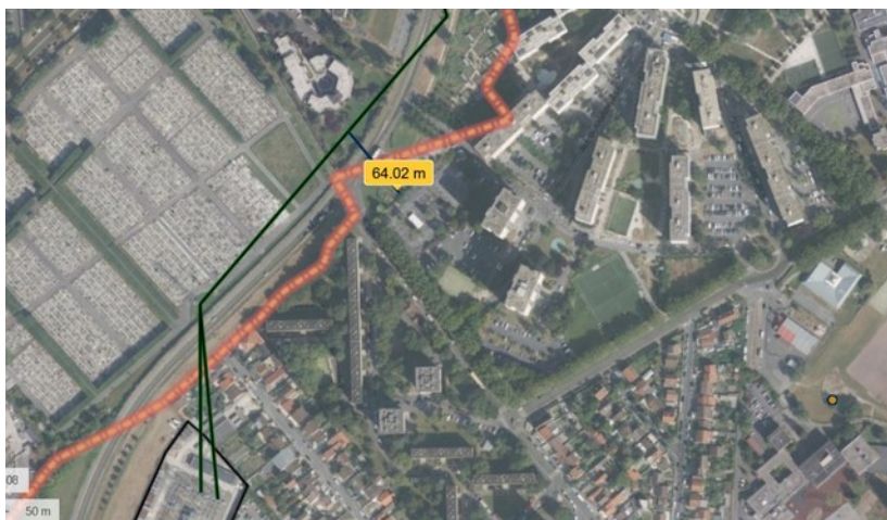
Figure 1: distance entre le secteur appelé à évoluer et les lignes à très haute tension