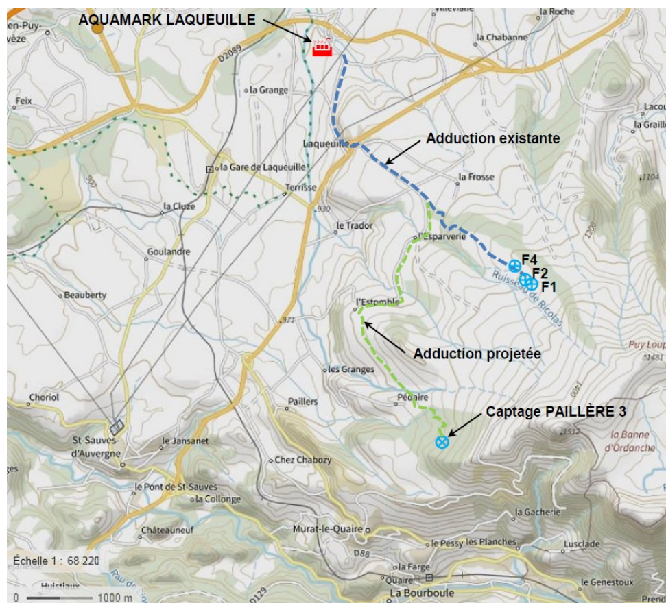
Illustration 1: Plan de situation du projet.

Ainsi, la société Aquamark a sollicité un partenariat avec la commune de Murat-le-Quaire, dont les huit captages destinés à l'alimentation en eau potable s'avèrent a priori excédentaires au regard des besoins à long terme de la collectivité, sans les quantifier toutefois. Le projet résultant de ce partenariat consiste en l'utilisation d'un volume annuel initialement prévu de 220 000 m 3 , puis limité (à titre de précaution, face à la probable réduction de la ressource résultant du changement climatique) à 175 000 m 3 prélevé depuis le captage de « Paillère 3 », le plus excédentaire.