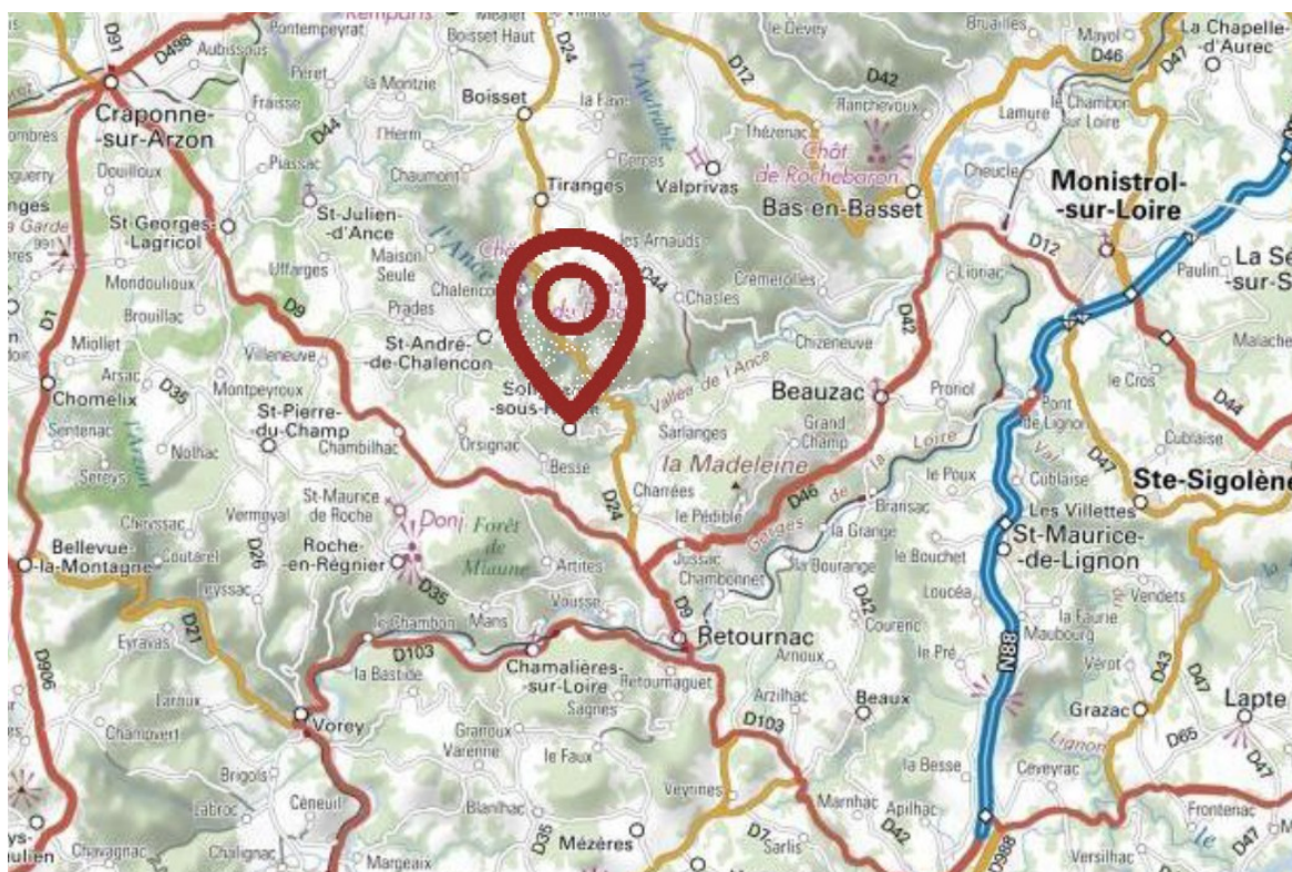
Figure 1: Localisation de Solignac-sous-Roche- RP p.7

La commune de Solignac-sous-Roche est située au nord du département de la Haute-Loire (43), à une cinquantaine de kilomètres des agglomérations de Saint-Etienne et du Puy-en-Velay. Ce village de 266 habitants 1 et d'une superficie de 865 ha est compris dans le périmètre de la communauté de communes Marches du Velay-Roche-Baron et dans celui du schéma de cohérence territoriale (Scot) Jeune Loire 2 . Ce territoire aux caractéristiques rurales est classé en zone de montagne (altitude variant entre 530 m et 862 m) et composé en sus du bourg de trois hameaux principaux : Crespinhac, Boubas et Besse.