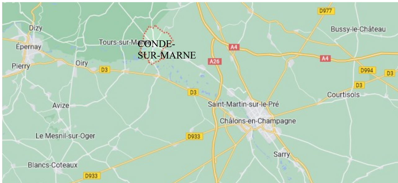
Figure 1: Localisation géographique de la commune de Condé-sur-Marne

Condé-sur-Marne est une commune de 755 habitants (INSEE, 2020) située dans le département de la Marne à 17 km de Châlons-en-Champagne. Elle fait partie depuis le 1 er janvier 2014 de la communauté d'agglomération de Châlons-en-Champagne 19 , qui regroupe 46 communes.