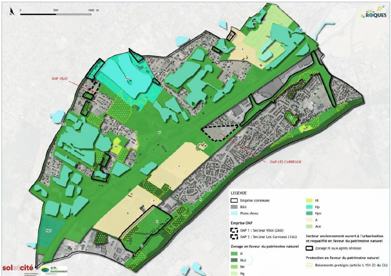
Localisation des OAP et zonage A et N après révision

La commune s'est fixée un objectif démographique de 2100 habitants supplémentaires sur la période 2018-2033 correspondant à une croissance de l'ordre de 3 % par an.