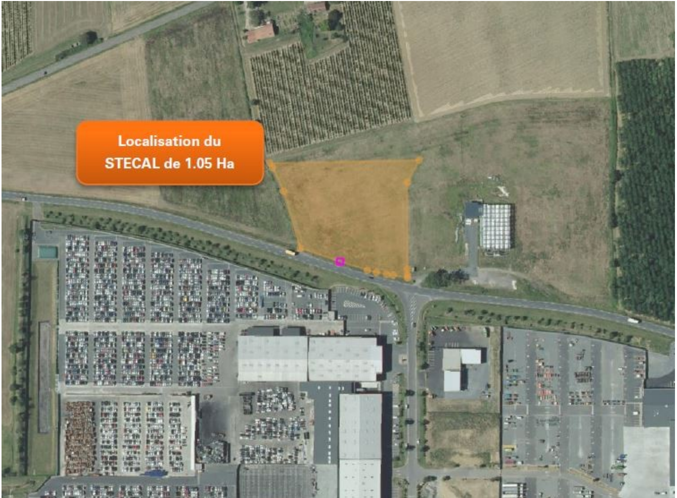
Localisation du projet de STECAL en zone agricole protégée

L'objet de la révision du PLU se situe en limite d'un espace agricole très ouvert, au pied des coteaux du gaillacois (les premiers reliefs sont à 700 m au nord du site). Bien qu'en contact direct avec la zone d'activités du Mas de Rest, la parcelle est immédiatement au nord de la RD18 qui constitue une coupure entre l'urbanisation et la zone agricole.