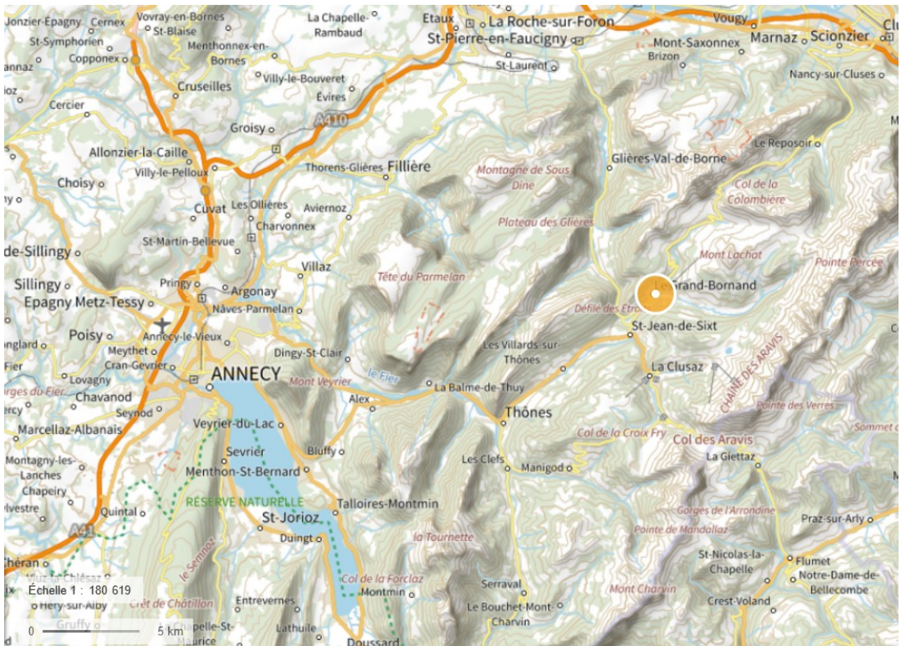
Figure 1: Localisation du Grand-Bornand

Le remplacement du télésiège de la Taverne est présenté par la commune du Grand-Bornand dans le département de la Haute-Savoie. Son domaine skiable s'étend sur 360 ha entre 935 m et 2 050 m d'altitude et possède vingt-quatre remontées mécaniques, 84 kilomètres de pistes répartis sur quatre secteurs (le plateau de la Joyère, le plateau du Rosay, le secteur du Chinaillon et la vallée du Maroly) et un réseau d'enneigement de 280 enneigeurs couvrant près de 50 % du domaine skiable en neige de culture.