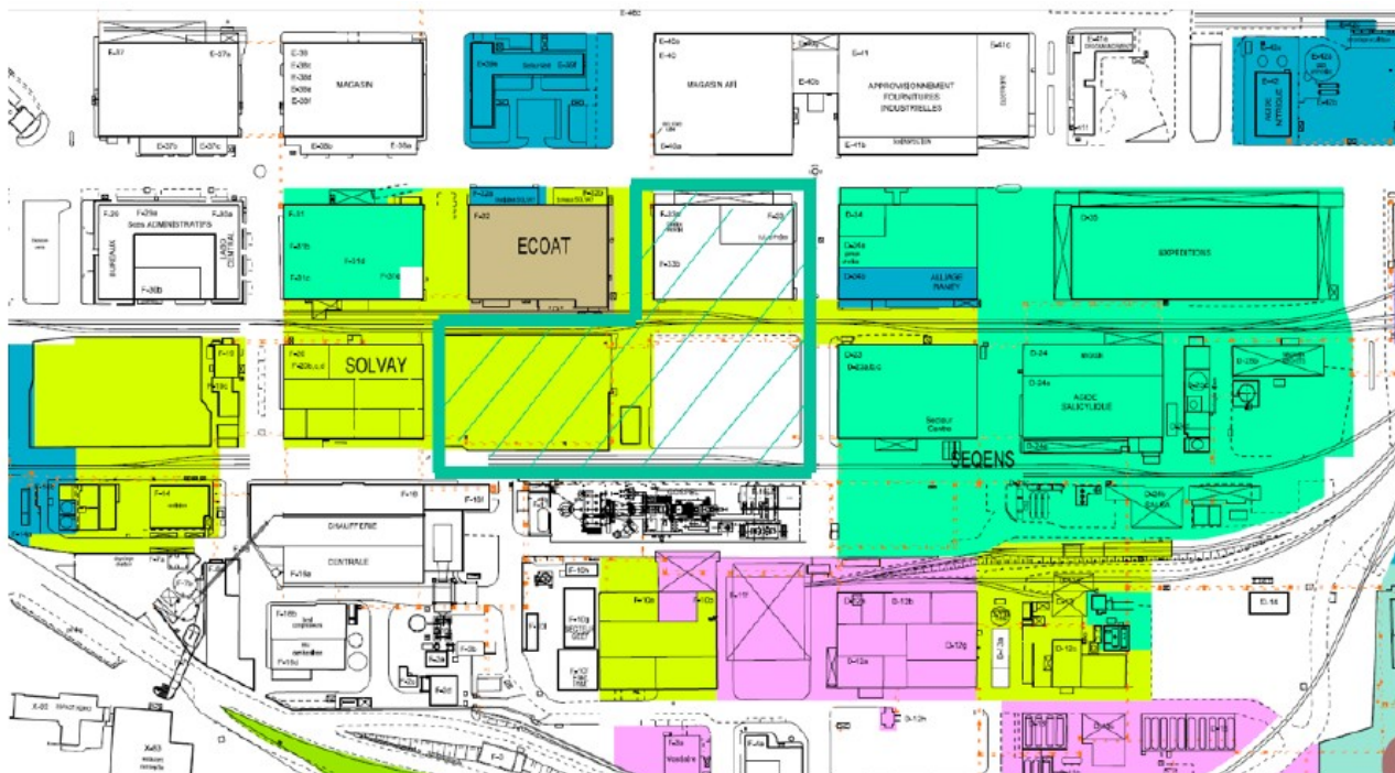
Figure 2 : localisation du projet (périmètre en trait vert épais) par rapport au site actuel de Novacyl (aplats de couleur verte)