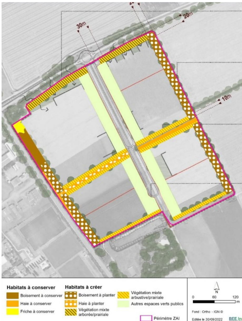
Figure 3 : Cartographie des mesures d'accompagnement