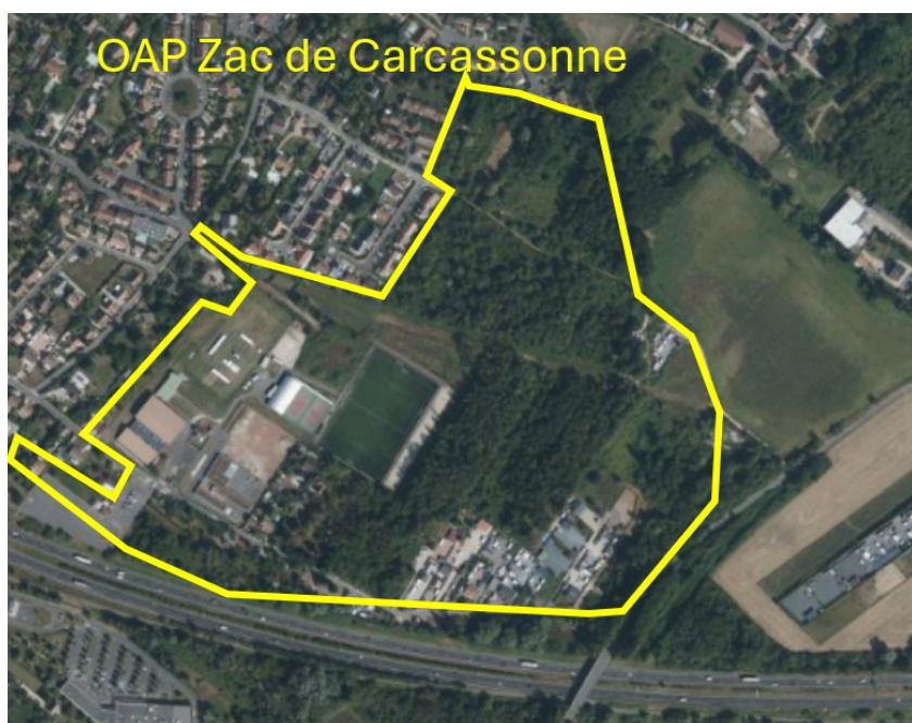
Figure 2: Localisation de l'OAP "Zac de Carcassonne"

Le secteur d'OAP « Guillerville » s'étend sur un secteur de 1,1 ha, classé en zone 1AU dans le règlement graphique du projet de PLU révisé. Il a pour objet de répondre aux besoins d'équipements liés au développement résidentiel et à l'accueil de nouveaux habitants.