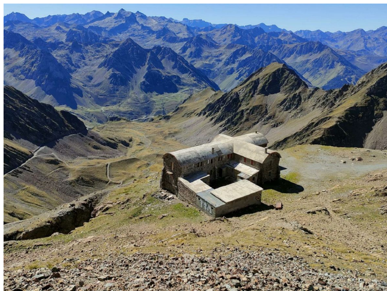
Figure 1 : localisation du projet et photo du bâtiment actuel (vue panoramique)

Le projet a pour objectif de restituer au bâtiment actuel sa vocation initiale d'hôtellerie d'altitude correspondant aux exigences contemporaines. L'hôtellerie des Laquets développe après restructuration 843 m 2 de surface de plancher.