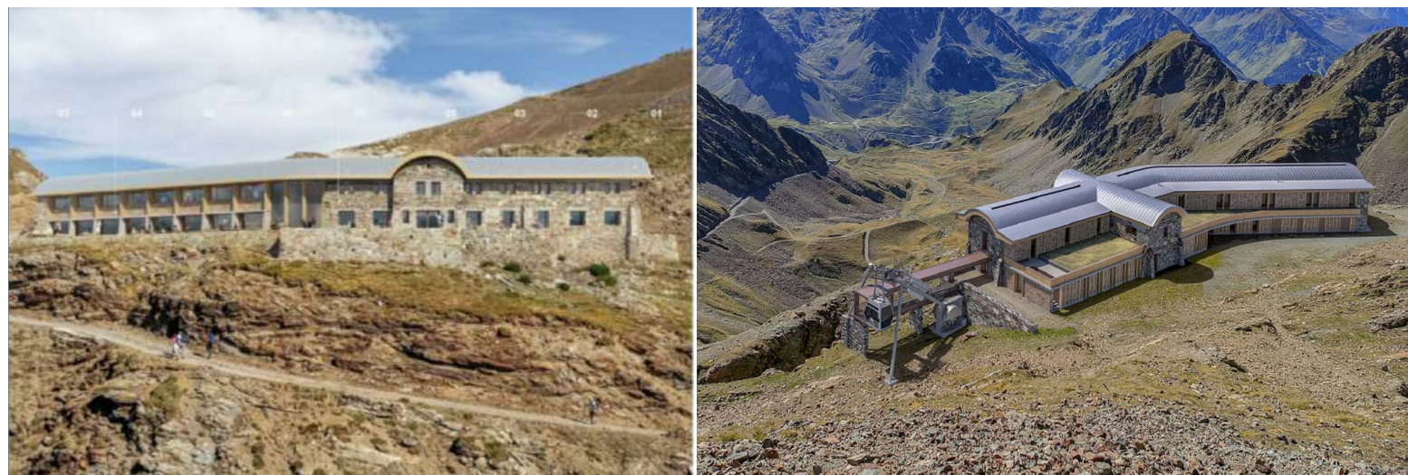
Figure 2 : photomontages présentant le bâtiment une fois les travaux terminés – réalisation Architecte 360 °

Enfin, ce bâtiment sera relié au Pic du Midi via la création d'un ascenseur sur câble avec arrivée en pignon sur la partie est de l'hôtellerie. L'installation aérienne proposée consiste à réaliser un appareil à câble comportant une seule cabine « va ou vient » de 15 places qui roule sur deux câbles porteurs +1 câble tracteur et ne comporte aucun ouvrage entre la gare du pic et l'hôtellerie.