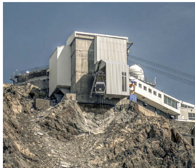
Figure 3 : photomontages présentant la jonction de l'ascenseur à l'Hostellerie (photo de gauche) et le départ de ce dernier depuis le Pic du Midi (photo de droite) – réalisation Architecte 360 °