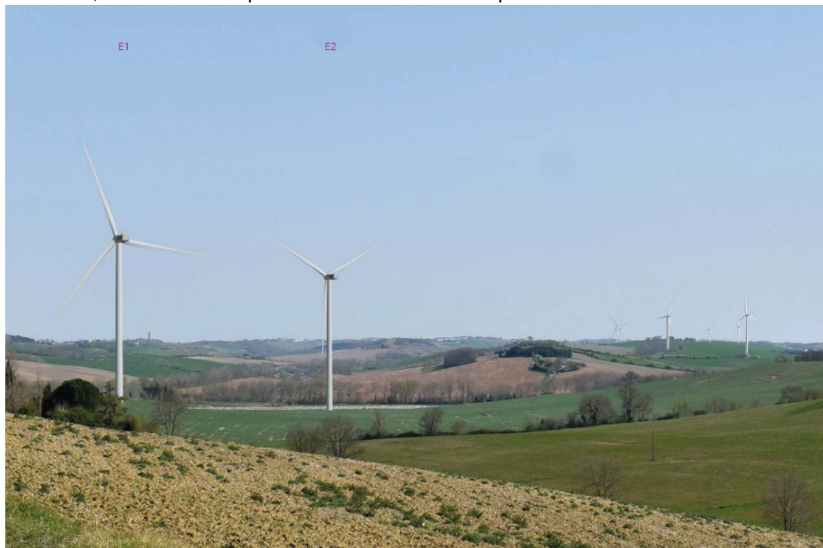
Photomontage de E1 et E2 depuis les Gabaches

lyse les covisibilités potentielles entre des parcs éoliens existants / autorisés et le projet. Si l'on peut admettre que les interférences visuelles avec les parcs d'Avignonet-Lauragais et le projet de Cintegabelle sont faibles, voire inexistantes, la MRAe estime que la relation visuelle avec le parc éolien de Calmont est bien réelle.