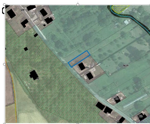
Figure 1: Zonage après la révision dite allégée n°1 le rectangle entouré de bleu met en évidence la modification