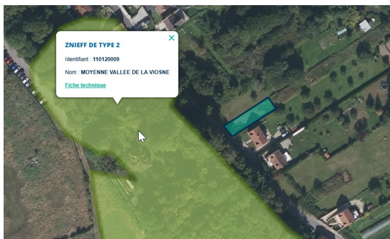
Figure 4 : Localisation de la partie de la parcelle concernée par la révision allégée du zonage (cadre bleu) par rapport à la Znieff de type 2 "Moyenne Vallée de la Viosne"