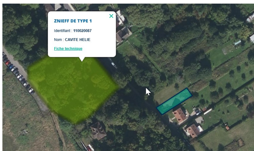
Figure 3: Localisation de la partie de la parcelle concernée par la révision allégée du zonage (cadre bleu) par rapport à la ZNIEFF de type I, « Cavité Hélié »