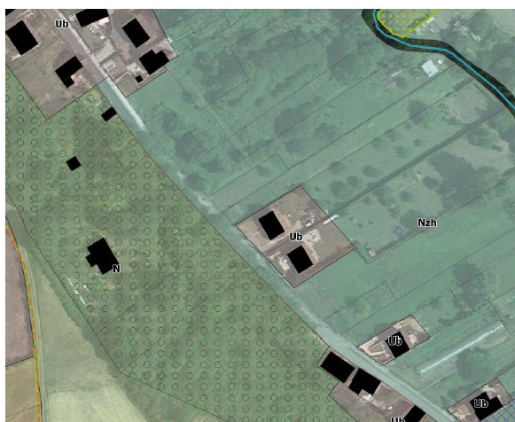
Figure 2: Zonage avant la révision dite allégée n°1

Considérant les objectifs de la révision dite "allégée" n° 1 du plan local d'urbanisme de Chars, qui consiste à modifier le plan de zonage afin de requalifier une partie (264 m 2 ) de la parcelle AE 187, actuellement classée en zone naturelle humide (zone Nzh) ( ) en zone urbaine (zone Ub) pour permettre la construction d'un pavillon ;